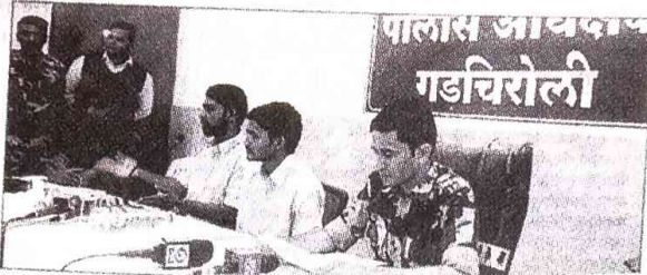
महलवाद्यांच्या तावडीतून सुटका झालेले पुण्याचे तीन मुदक.

भारत जोडो अभियानासाठी पुणे-भामरागड-दोरेवाडा ते मलखानगिरी अशा महाराष्ट्र-छत्तीसगड-ओडिशा या महलप्रत तीन राप्तांत साककन यांकरिता पुण्यात निघालेल्या अ महलवाद्यांनी अपहृत केलेल्या या तरुणांची चौकस, ३ जानेवारीला सुटका केवळच नव्हतय तर पोलिसांनी त्यांना यूपकरी फाटे गडचिरोली पोलिसांच्या सुट्टी केले. या शेळी त्यांनी अपहरणानंतरच्या ९६ तासांचा धरार कवन केला. ते म्हणले, इतर हिंसक २०१५ रोजी नागपुरात निघून आली गडचिरोली जिल्ह्यातील भामरागड मातृकालय ते मलखानगिरी पोहोचले. यानंतर २५ ते २८ डिसेंबर असा योजा वेढे, कासकेनी, बेरामगड प्रवास करून छत्तीसगडच्या बिनापुरला व २९ डिसेंबरला बसेरु झाला पोतचले. तेथेच