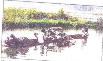
The students cross a river in the tribal region during their trip