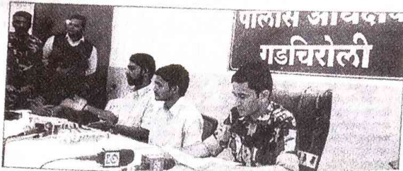
महलवाद्यांच्या ताबडीतून सुटका झालेले पुण्याचे तीन मुदक.

भारत जोडो अभियानासाठी पुणे-भामरागड-दोरेवाडा ते मलखानगिरी अशा महाराष्ट्र-छत्तीसगड-ओडिशा या महलप्रस्त तीन राज्यांत सावकलन याचकरिता पुण्यात निघालेल्या अ नखलवाद्यांनी अपहृत केलेल्या या तरुणांची चौकदार, ३ जानेवारीला सुटका करण्यावर जयदलपूर पोलिसांनी त्यांना चौकदार फाटले गडचिरोली पोलिसांच्या सुटका केले. या शेळी त्यांनी अपहरणानंतरच्या ९६ तासांचा धरार कवन केला. ते म्हणाले, इतर हिंस्र २०१५ रोजी नागपुरात निघून आली गडचिरोली जिल्ह्यातील भामरागड गावजवळील महलवाद्यांनी पोहोचले. जानेवर २५ ते २८ डिसेंबर असा यांचा वेळे, कायकेनी, बेरामगड प्रवास करून छत्तीसगडच्या बिनापुरला व २९ डिसेंबरला बसेरु झाला पोहोचले. तेथेच