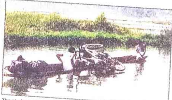
The students cross a river in the tribal region during their trip