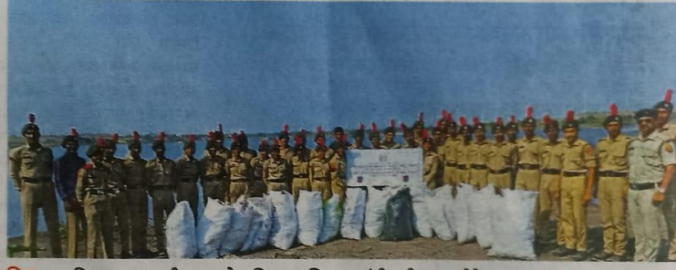
सिन्नर : महाविद्यालयाच्या राष्ट्रीय छात्र सेना विभाग अभियानाप्रसंगी राष्ट्रीय छात्र सेनेच्या सात महाराष्ट्र बटालियनचे अधिकारी व विद्यार्थी.